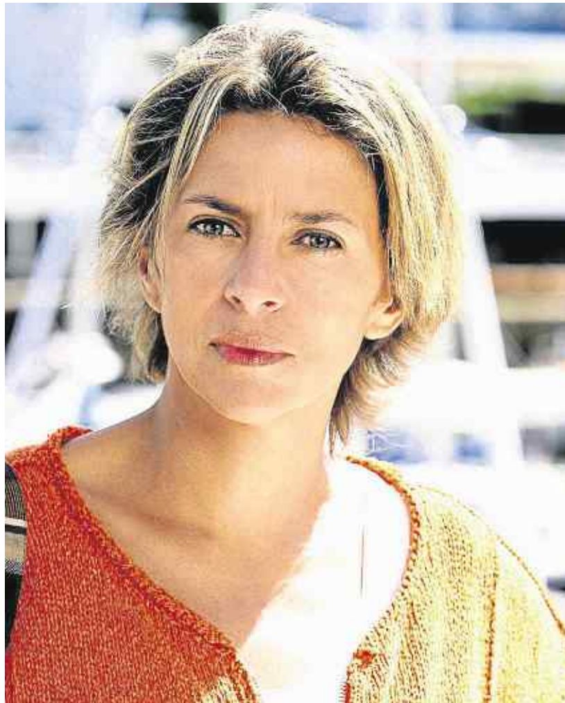
Corinne Touzet aime venir en Bretagne et dans le Morbihan en particulier. Elle rêve d'y posséder une maison.

Nous y sommes restés trois semaines. Ce qui rare et extraordinaire.