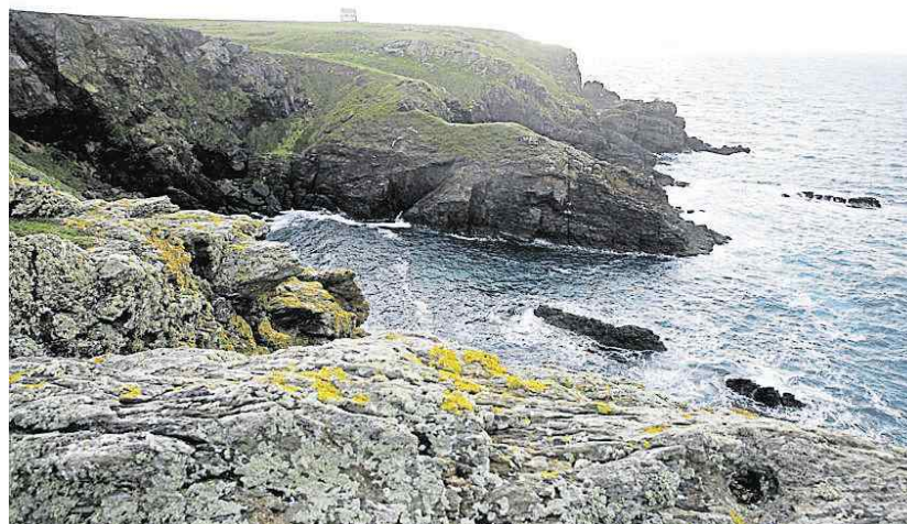
Corinne Touzet a tourné le film « La vie au grand air » sur l'île de Groix. Depuis, elle rêve d'y posséder une maison.